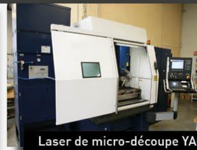
Laser de micro-découpe YAG

Possibilité de réaliser la prestation complète : Micro découpe LASER + Marquage LASER + Pliage