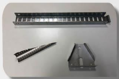
Pliage jusqu'à 3 mètres