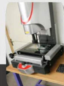
Scanner contrôle (x130)