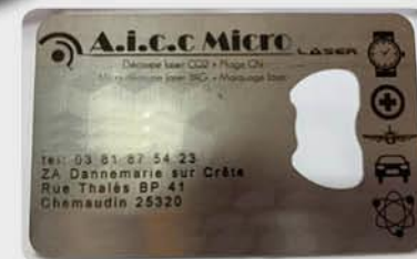
Carte de visite en Inox avec fonction décapsuleur