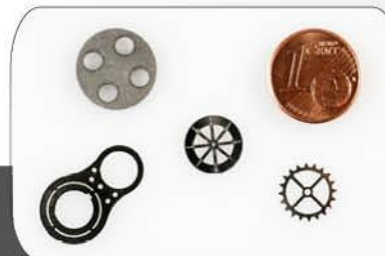
Épaisseur de découpe à partir de 0,01 mm

Possibilité traitement de surface Zingage + Peinture