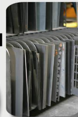
Stock de 0,01 à 1,50 Inox / tôles bleues cuivres / laitons

Possibilité de réaliser la prestation complète : Micro découpe LASER + Marquage LASER + Pliage