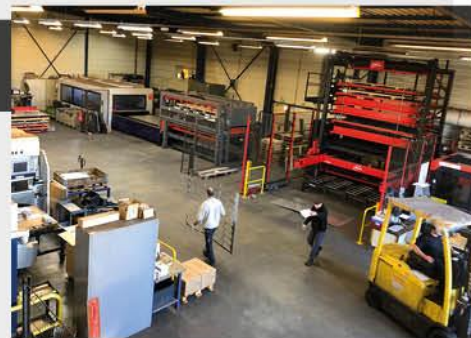
Format des tables de découpes 3000 x 1500 mm